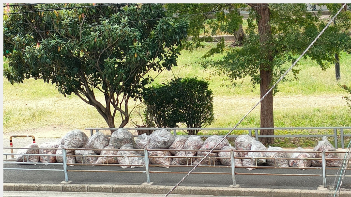
お陰様でとてもきれいになりました

お子さんをお持ちの親御さんはスマホなどに慣れておられるとの前提で、人数把握のため、HPで事前登録をお願いしていますが、飛び入りがあります。今回は問題は発生していませんが、登録を徹底していきます。